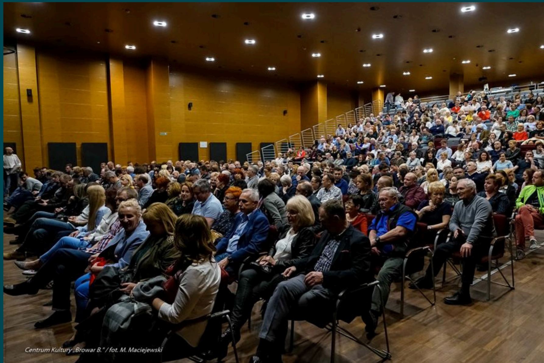
Centrum Kultury „Browar B.”